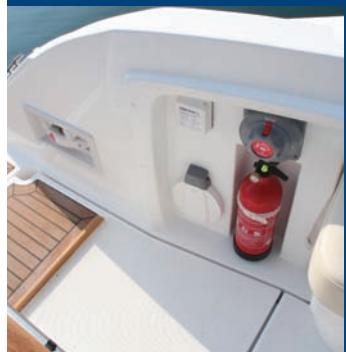
Hueco específico para el extintor.