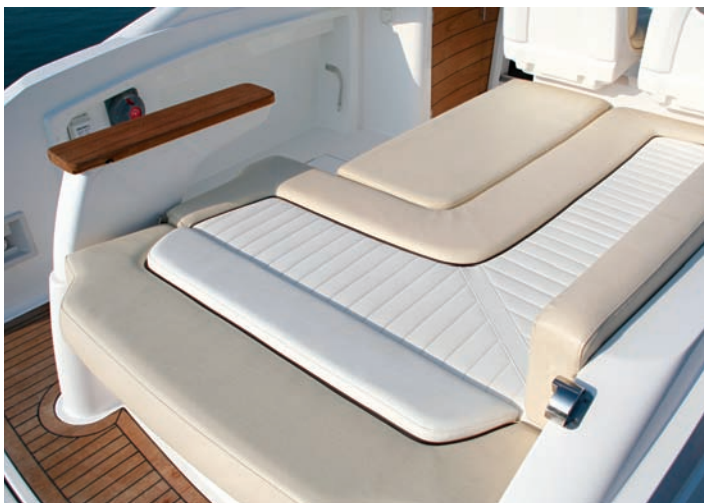
Se abate el respaldo de popa para ampliar el solárium posterior.

Con un casco marcado por dos alargadas escotillas en las bandas y una proa no muy lanzada