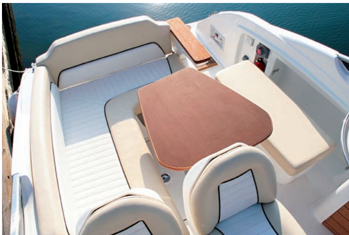
Al comedor exterior se añade el arcón-nevera para ampliar su capacidad.

La bañera ocupa una buena parte de la cubierta y dispone de un arco de antenas y forma curiosa que sirve también para soportar, en caso necesario, unas toldillas o unas fundas de fondeo plegables.