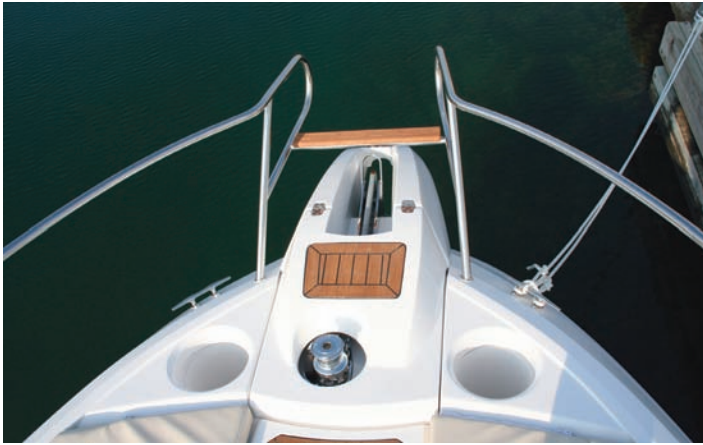
El cofre de fondeo se complementa con dos huecos para defensas.

Bajo la protección directa del parabrisas incluye junto a la escalera el puesto de gobierno, con una consola de color gris dotada de un práctico pasamanos curvado, capacidad para electrónica, reposapiés de madera y un asiento doble de posición regulable.