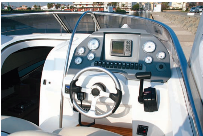
La consola ofrece una altura considerable y frontal para electrónica.

La popa ocupa una buena parte del espacio disponible con una dinette basada en asiento en forma de "L" y mesa desmontable, que se complementa con un asiento-arcón acolchado y