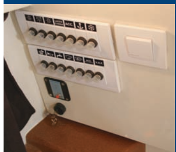
Caja de fusibles térmicos junto a la entrada.