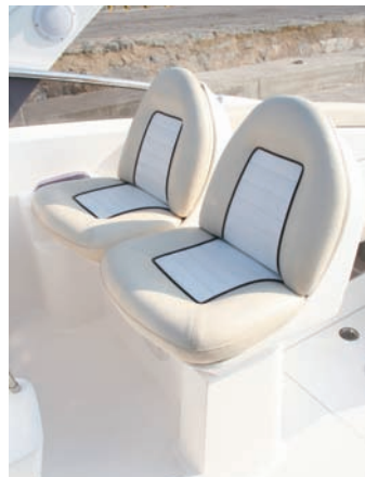
En el puesto de gobierno cuenta con dos asientos de respaldo separado.