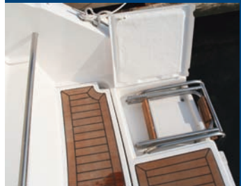
Escalera de baño con extensión posterior.

Gasolina desde 191 hasta 235 hp Diésel desde 160 hasta 240 hp