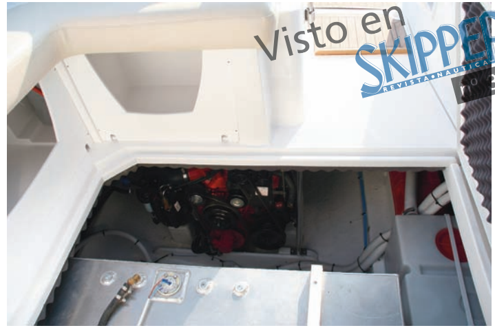
El acceso al motor es limitado por el cofre, pero se puede desmontar el suelo de la bañera.

móvil para crear un comedor o un segundo solárium dependiendo de la posición de la mesa y el respaldo.