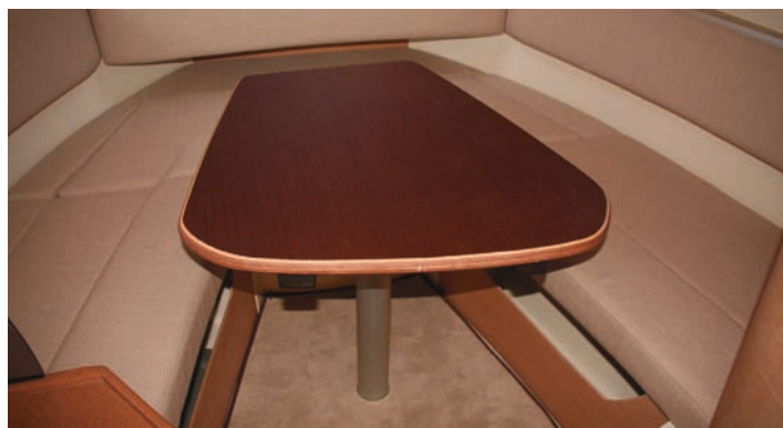
El comedor es práctico y con una buena mesa.