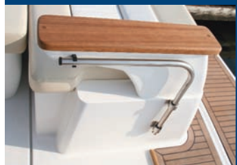
Puerta simple de forma tubular.