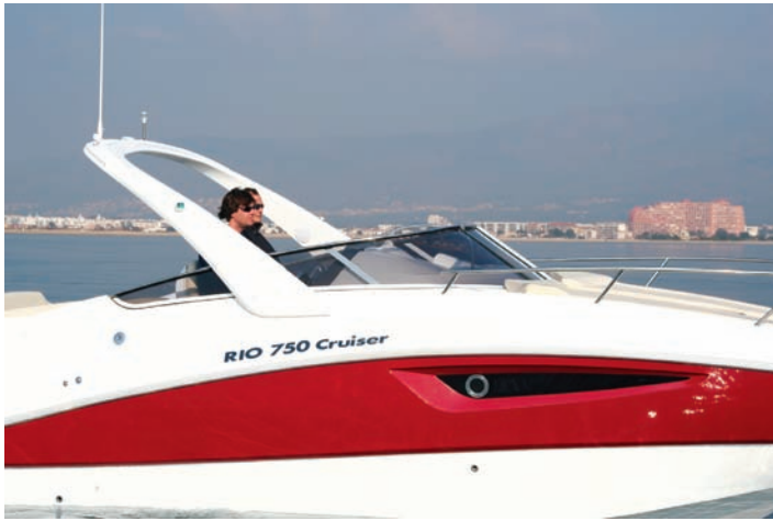
La posición del arco de antenas queda muy adelantado en la bañera.