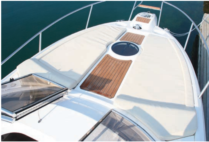
El solárium de proa se parte en dos mediante un pasillo central acabado en teca.