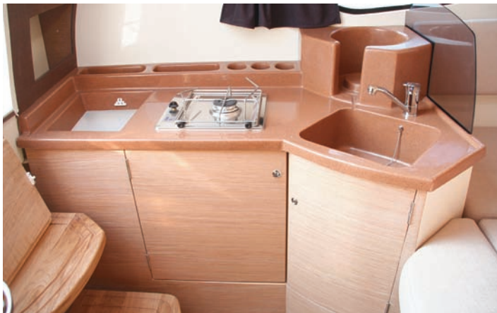
La encimera de la cocina tiene unas prácticas formas moldeadas portaplatos.