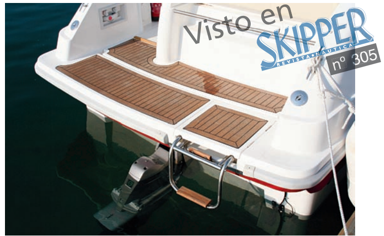
La plataforma es de buen tamaño para la eslora de la embarcación.

Su gama de modelos, una de las más completas del mercado en pequeñas esloras, incluye entre otras la serie Cruiser, enfocada