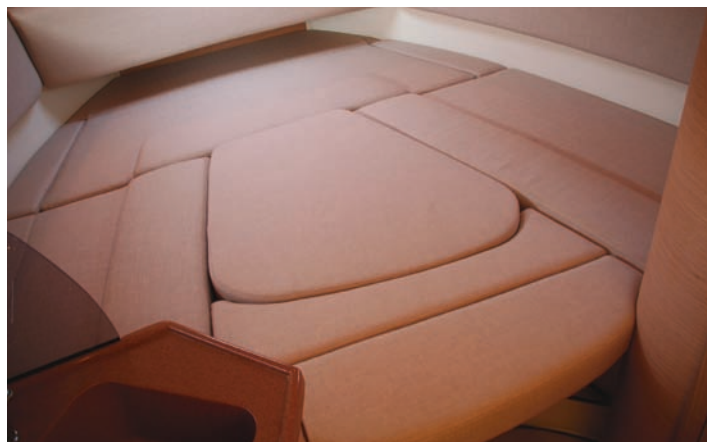
Con suplementos se forma una cama doble en la proa.