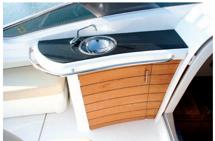
El mueble-bar exterior acoge una nevera eléctrica tras la puerta de madera.