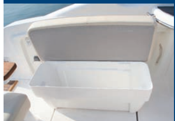
Arcón-nevera con tapa acolchada.