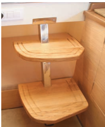
Tras la escalera de entrada se accede a una cama doble.