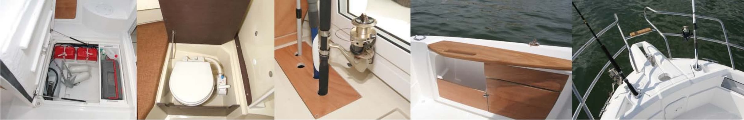
WC MARINO OPCIONAL