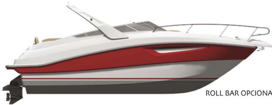
ROLL BAR OPCIONAL